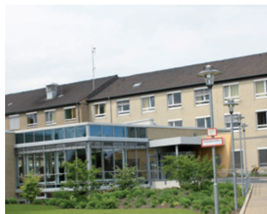
Spitzennoten für das St. Elisabeth-Hospital Meerbusch-Lank ... Schaffrath

Die AOK Rheinland/Hamburg ermittelte bei Versicherten zwischen 18 und 80 Jahren mit einem 16 Punkte umfassenden Fragebogen die Zufriedenheit mit dem Krankenhausaufenthalt.