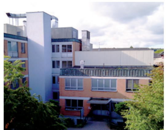
... und für das St. Irmgardis-Krankenhaus Süchteln.