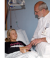
Mithilfe Kostenlose OP für junge Mutter