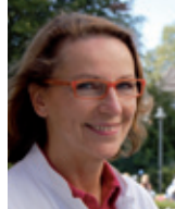
Medizin Neues Verfahren zum Brustaufbau nach OP